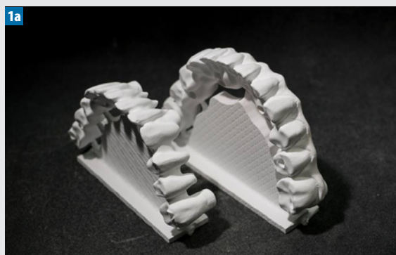
Fot. 1a-b. Suprastruktura protetyczna i Toronto: widoki od strony policzkowej

W artykule przedstawiono dwie prace: Suprastrukturę protetyczną i Toronto, które stosowane są u pacjentów bezzębnych poddanych leczeniu implantologicznemu z wykonaniem uzupełnień stałych. Często struktury te odtwarzają także ubytki tkanek miękkich bezzębnego wyrostka zębodołowego. Suprastrukturę protetyczną i Toronto całkowicie wykonano z konstrukcyjnego tlenku cyrkonu z zastosowaniem otwartego systemu CAD/CAM w pracowni protetycznej LABDENT. W tym celu użyto maszyny VHF S1 wykorzystującej oprogra-